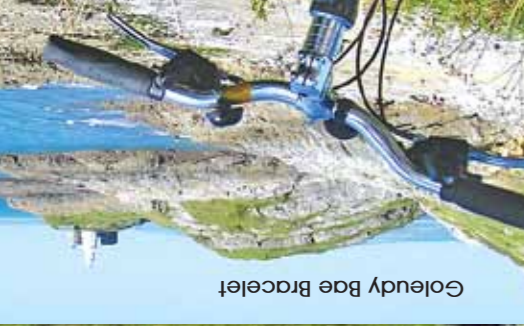
Goledy Bae Bracelet